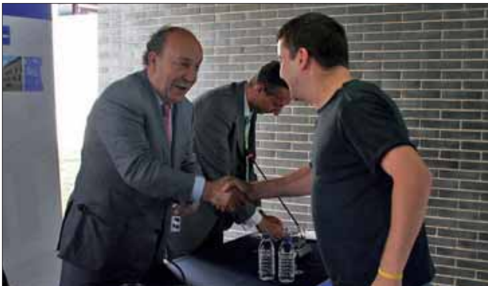
El Alcalde de Las Rozas durante el acto de entrega

Los pisos, de 3 y 4 dormitorios, tienen una superficie de entre 98 y 154 m 2 construidos y cuentan con 2 plazas de garaje y trastero. Distribuidos en dos urbanizaciones, ambas están dotadas con zonas ajardinadas, área de recreo infantil y piscina. Los precios de las viviendas, entre las que hay áticos y bajos con jardín, oscilan entre los 208.000 y 284.000 euros, y forman parte de la primera fase del Plan que consta en total de 800 viviendas (600 en régimen de alquiler con opción a compra).