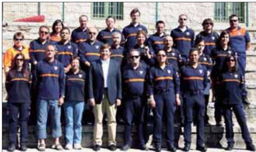
En la imagen, los nuevos voluntarios junto al Jefe de Policía Local de Las Rozas

Es la primera vez que voluntarios roceños participan en este curso y ya se prepara un nuevo grupo. En esta ocasión, han sido el grupo más numeroso de este curso que duró de abril a junio. Siguieron el mismo 246 voluntarios, procedentes de 46 municipios madrileños . Además, han realizado prácticas de montaje de tiendas de campaña, instalación de cadenas, funcionamiento de vehículos de incendios y sanitarios así como intervenciones con helicópteros.