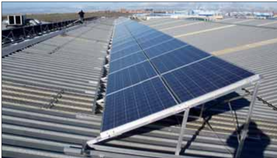
En la imagen, paneles solares instalados en el municipio

La Exposición España Solar tenía como objetivo fomentar la implantación de energías renovables, haciendo hincapie en la solar a nivel local, y difundir las actuaciones ya desarrolladas ; para ello, se instalaron 20 paneles en los que se explicaban las actuaciones de los ayuntamientos en energías renovables: solar térmica, fotovoltaica y otras menos utilizadas como la eólica o la utilización de la biomasa.