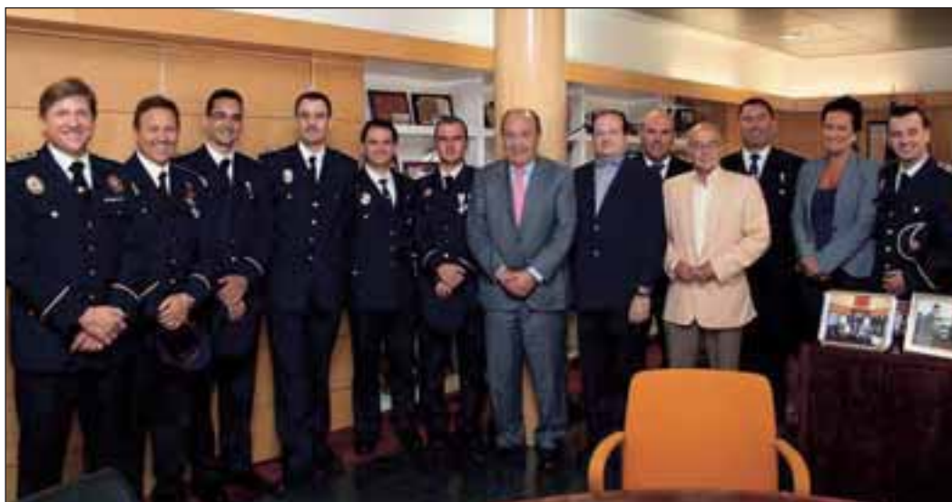
En la imagen, el Alcalde, el Concejal de Seguridad, la Concejala de Personal, el Secretario y el Jefe de Policía Local y el Oficial de Policía junto a los nuevos cargos

Este acto da por terminado el proceso de tres meses de formación que estos miembros de la Policía Local han tenido que realizar y que se trataba del curso homologado de ascenso que se imparte en la Academia de Policía Local de la Comunidad de Madrid. En él se les ha instruido sobre los conocimientos específicos de sus puestos y las funciones que a partir de este momento deberán realizar.