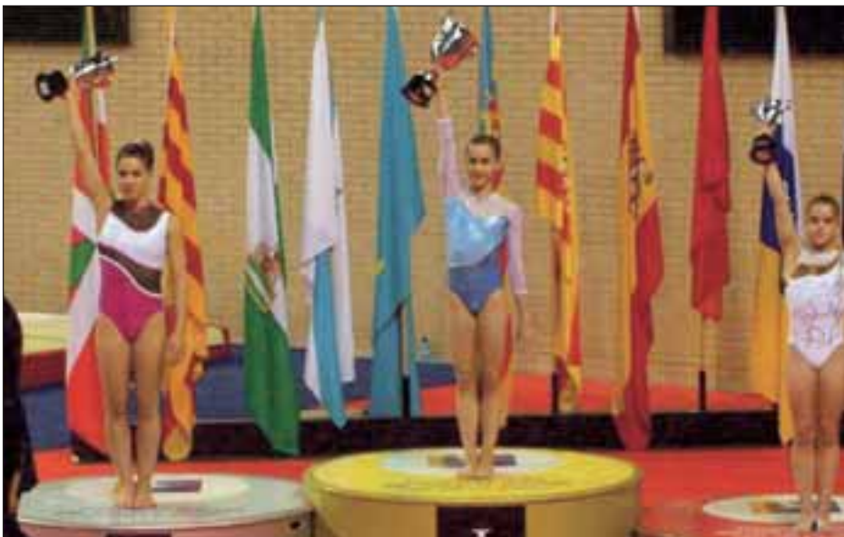
La jovencísima gimnasta en el podio junto a la plata y el bronce